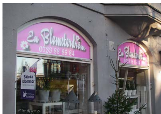
Fönsterdekalers istället för fasadskylt