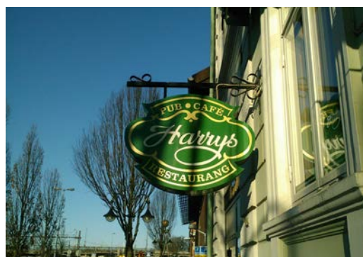
Invändigt belyst flaggskylt