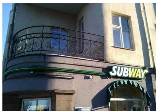
Sammanhängande markering med neonrör

Även vepor och banderoller räknas som skylt och är bygglovspliktiga inom detaljplan. Då dessa har en tillfällig karaktär ska endast tidsbegränsade bygglov ges. Denna typ av skylt används oftast vid tillfälliga kampanjer och då gäller att upp till 10 dagar kan den sättas upp utan bygglov. Är avsikten att den ska sitta uppe i mer än 10 dagar så måste bygglov beviljas och startbesked ges innan skylten sätts upp. Tänk på att tillstånd från fastighetsägaren alltid krävs.