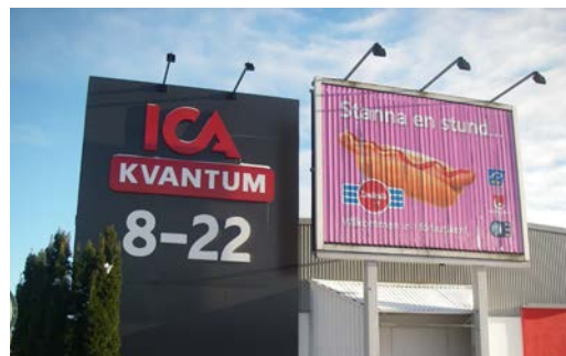
Exempel på bildväxlande skylt

Hänvisningsskyltar till enskilda företag eller inrättningar tillåts endast om behovet inte kan lösas med skylt på aktuell fastighet eller med gemensamma orienteringstavlor för ett större verksamhetsområde. För mer information om hänvisningsskyltar kontakta tekniska avdelningen.