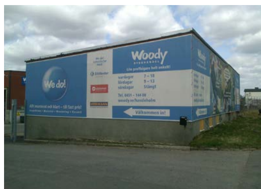
Tillfällig vepa, lovpliktig