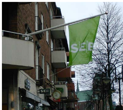
Flagga på fasad