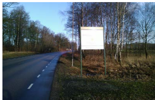
Kommuninformation vid infartsväg