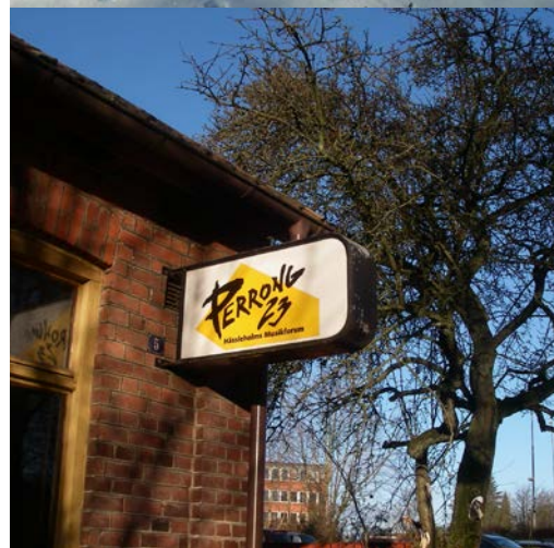
Exempel på vad som kan betraktas som skylt