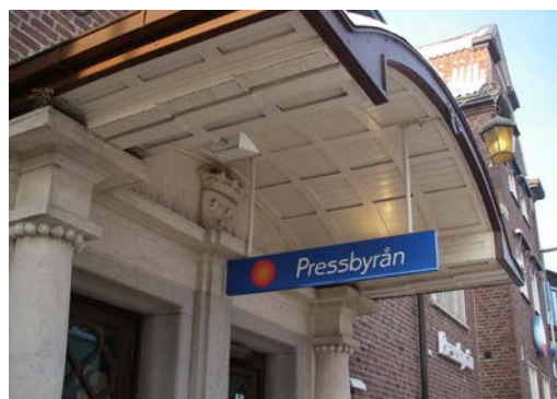
Skylt med liten påverkan på byggnadens karaktär