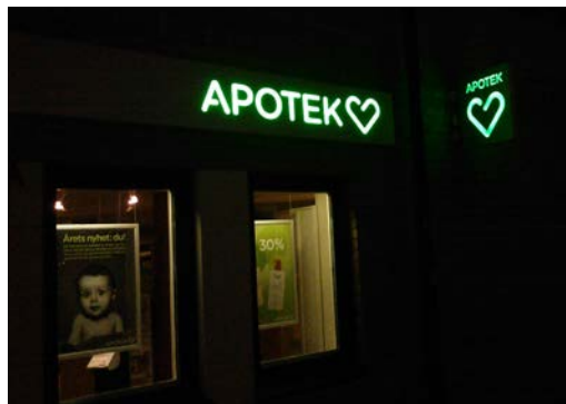
Invändigt belyst skylt