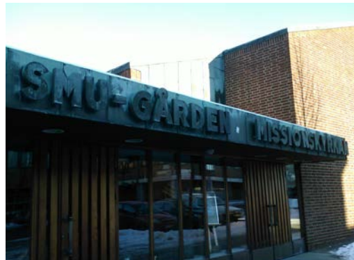
Skylt och fasad utgör en arkitektonisk helhet

Vid infartsvägar till tätbebyggt område ska reklamskyltar undvikas till förmån för kommuninformation. Ur trafiksäkerhetssynpunkt är det olämpligt med braskande reklam som lätt avleder uppmärksamheten från trafiken. Skyltar i trafikmiljö ska vara enhetligt utformade, informativa och vägleda kommunens besökare. Mindre skyltning på exempelvis busskurer kan tillåtas om det bedöms kunna göras utan men för trafiksäkerheten.